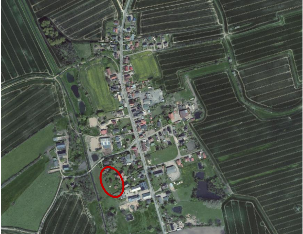
Abb.: Ausschnitt Luftbild, Quelle: Digitaler Atlas Nord

Die Ortschaft Sipsdorf liegt am nördlichen Rand der Gemeinde Lensahn, westlich der BAB 1 und wird durch die Oldenburger Straße (K 59) in Ost-West-Richtung gegliedert. Westlich von Sipsdorf verläuft die Johannisebek. Der Ergänzungsbereich befindet sich im südwestlichen Bereich der Ortschaft, westlich der Kreisstraße.