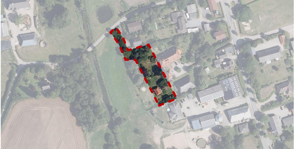
Abb.: Ausschnitt Luftbild

Die Gemeindevertretung der Gemeinde Lensahn hat am 24.06.2020 die Aufstellung einer zweiten Ergänzung der geltenden Abrundungssatzung in Sipsdorf beschlossen. Ziel ist es ein Baugrundstück in den im Zusammenhang bebauten Ortsteil mit einzubeziehen, um das bereits bestehende historische Backhaus zu Wohnzwecken umzunutzen.