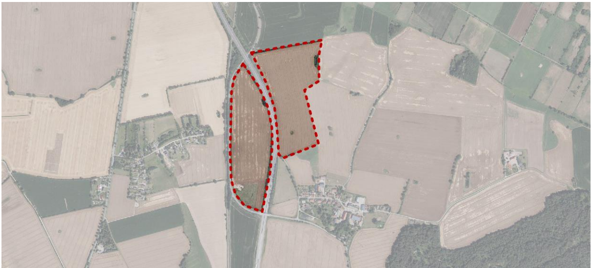
Abb.: Luftbild mit Geltungsbereich, Digitaler Atlas Nord

Das Plangebiet befindet sich in der Gemeinde Damlos und nordwestlich von Sebent. Das Vorhabengebiet besteht aus zwei Teilbereichen. Die Teilbereiche befinden sich beidseits der BAB A1 und östlich der Bahntrasse.